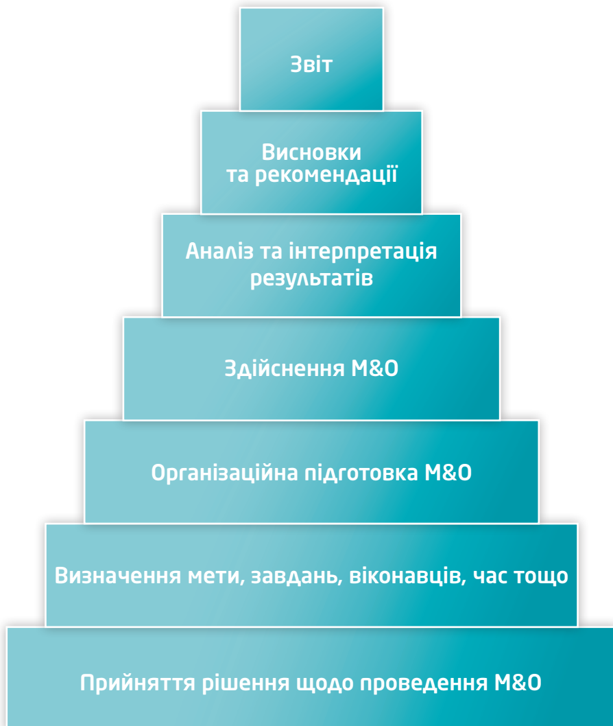
Схема процесу проведення моніторингу